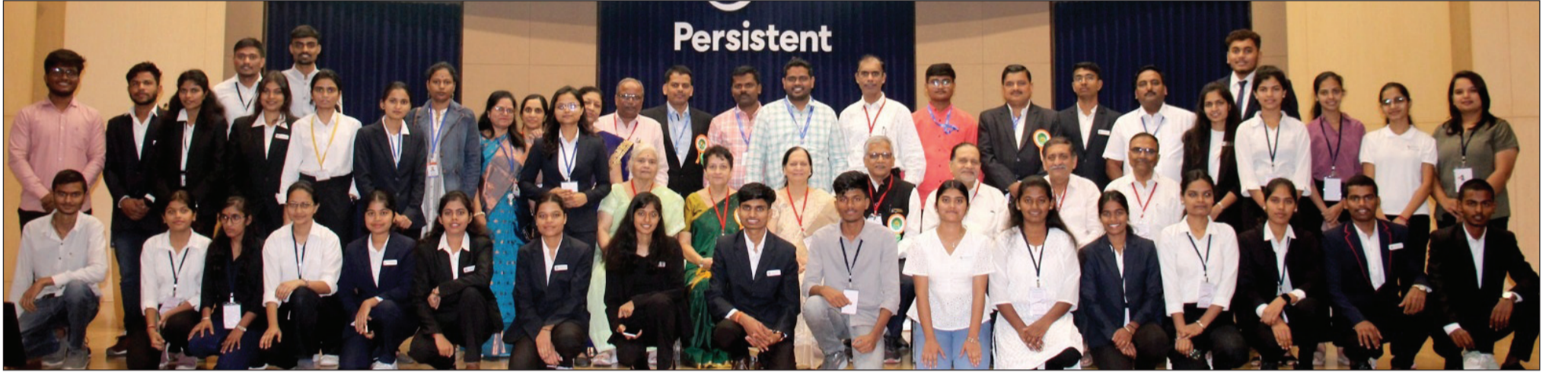
विद्यार्थी साहाय्यक समिती आयोजित उद्योजकता परिषदेत मान्यवरांसह व्यवस्थापनातील विद्यार्थी

अॅग्रीबिझ कनेक्ट- २०२४ उद्योजकता परिषद, ३०० मुलामुलींचा सहभाग